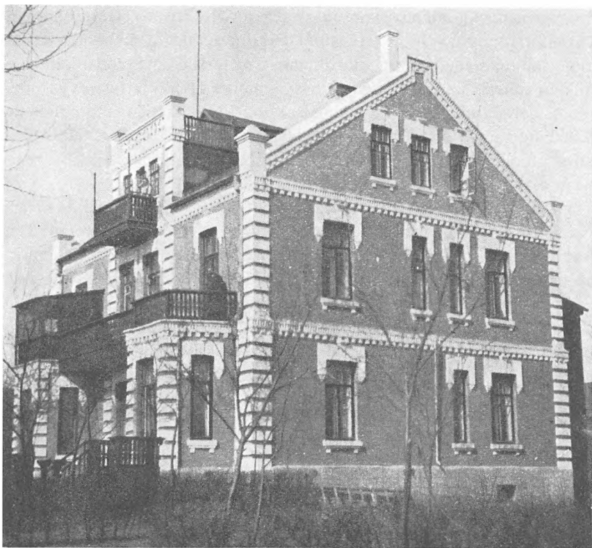
Den danske missionsstation i Harbin, som den så ud i begyndelsen af 1930'erne.

riske miljø, ikke blot fra lokalbeskrivelses-folkenes egne rækker, og der er lejlighedsvis også artikler, skrevet på bestilling, af landskendte historikere og lokalbeskrivelses-eksperter fra andre byer end Harbin. I det følgende vil nogle aspekter af den lokalhistoriske produktion blive karakteriseret med eksempler hentet fra »Harbin lokalhistorie.«