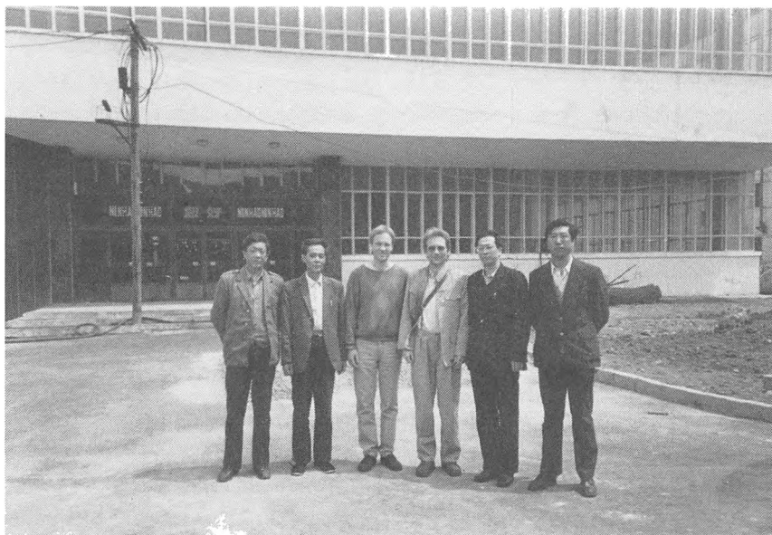
Forfatterne sammen med medlemmer af »den lokale skrivegruppe« på Harbin Lokomotivvognsfabrik.

folk, hvoraf en del har været aktive i det lokalhistoriske arbejde i mange år, og den har opnået anerkendelse som en af de ganske få forskningsenheder i Kina, bortset fra de centrale partihistoriske institutioner i Beijing, der systematisk arbejder med forholdet til Sovjetunionen og Sovjets rolle i Nordøstkina 21 . Den sidstnævnte afdeling blev startet i 1988 med seks ansatte, og kan endnu ikke opvise nogen resultater. Det er imidlertid bemærkelsesværdigt, at udover lokalbeskrivelses-folkene er partihistorikerne de eneste i det lokalhistoriske forskningsmiljø, som arbejder med perioden efter 1949.