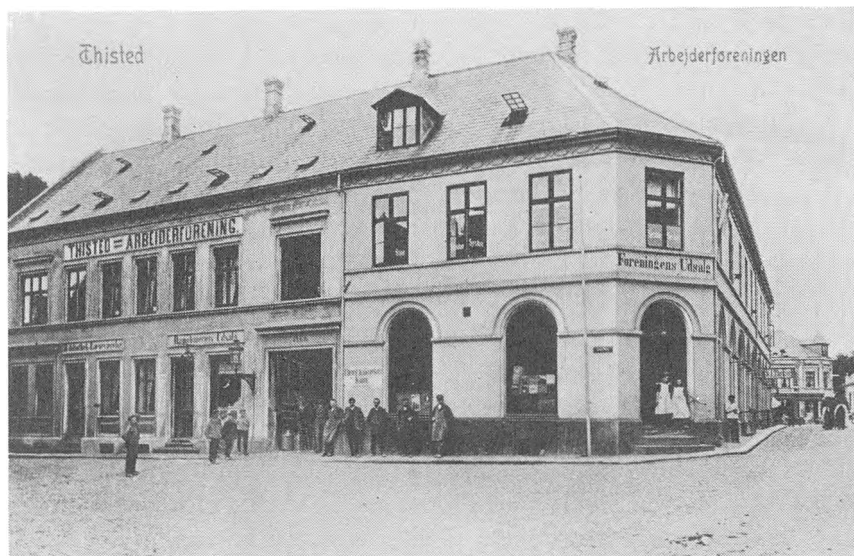
Thisted Arbejderforenings bygning, hvor der fra 1876 blev solgt øl og brændevin. Til venstre ses læsestuen, der var betydeligt større end Afholdsforeningens. Arbejderforeningen påtænkte at bygge en forsamlingsbygning i 1884, men opgav formentlig på grund af, at afholdshjemmet blev bygget samme år. Udateret postkort på Det kongelige Bibliotek.