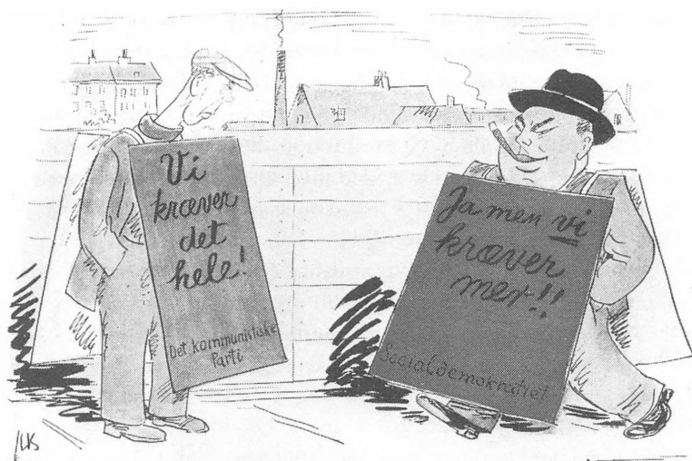
Fra den røde flers

At Fremtidens Danmark skulle ses som et udslag af socialdemokratisk overbudspolitik overfor kommunisterne var et udbredt synspunkt i 1945. (Blæksprutten 1945).