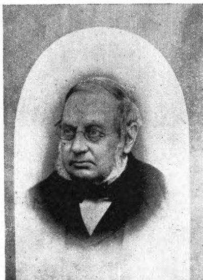
N. J. Theodor Wolf, 1813–90, Apoteker.