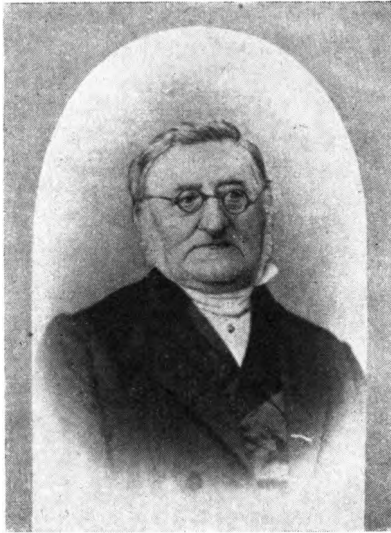
Ejler S. Wolf, 1800–88, Provst.