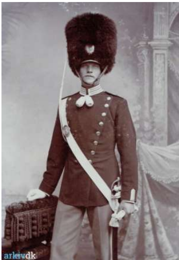
- og som garder