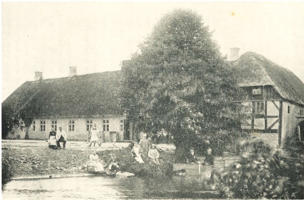
FRA DEN GAMLE MØLLEGAARD. (Facaden mod Øst).