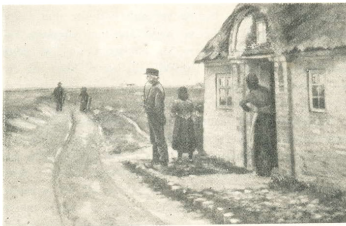
Frk. E. Mundt: Kunstnere gaar forbi et Hus i Vestjylland.

Der kom Fart i de gamle Fingre, og snart havde han et større Lager, som blev afsat til de forskellige Banegaarde Landet over. Den lille Hedeindustri gik saaledes ind i en Opblomstringsperiode, og Karlen tjente sig til en Amerika-billet. Derovre tjente han om Dagen og læste om Aftenen, indtil han var perfekt i Engelsk. Senere gennemgik han et 3-aarigt Kursus paa Palmer chiropractic Skole. Kommen tilbage til Danmark nedsatte han sig i Horsens som Kiropraktiker, hvilken Gerning han øver endnu, ja, er nu endog Formand for sin Stands Sammenslutning i Danmark.