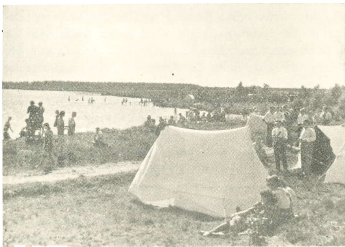
Sommerliv ved Kvie Sø.

ling Sø, samt mange andre Smaaplantager og Hegnsplantninger rundt om i Sognet. Alle disse Plantninger har været med til at give Sognet et andet Udseende, ligesom det hjælper til at bryde Vindens Magt og derved hindre Sandflugtens skadelige Virkninger. Ogsaa i dyrkningsmæssig Henseende har det haft sin store Betydning; Markerne udtørres ikke saa hurtigt, og Sommerregnen synes ikke saa let at at gaa uden om de Egne, hvor der findes en Del Skov eller anden Trævækst.