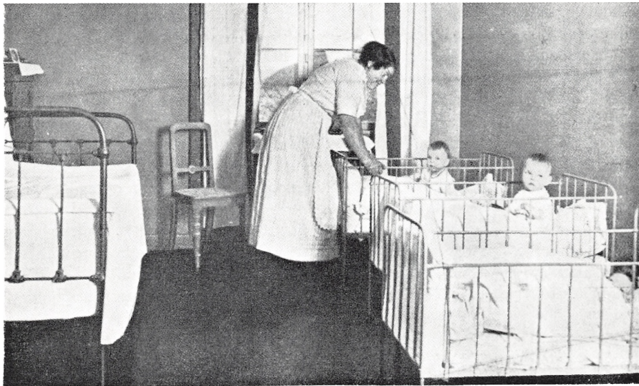
En af de velindrettede stuer i hjemmet, hvor en moder bor som amme for et eller to børn foruden sit eget.

slukket for gassen og der blev sat en lille petroleumslampe ind på hvert værelse. Mange af mødrene kom fra landet og de moderne indretninger var ganske ukendte for dem. En moder ville således slukke gaslampen ved at puste flammen ud, og kun den opmærksomme nattevagt forhindrede en ulykke. Arbejdet var lagt til rette i en fast rytme med rengøring af eget værelse og vask om de to børn. Andet husarbejde blev udført på skift. Morgen og aften blev der holdt andagt. Også fritimer og friaftener blev der tænkt på. Hvis plejebarnet trivedes særlig godt fik plejemoderen en kontant belønning. Omkring århundredskiftet nævnes det, at ammerne fik 6 måltider om dagen, hvoraf de to gange var varm mad. Års-