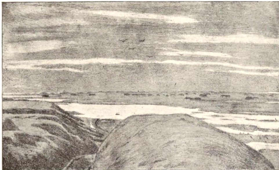
Harboøre set fra Engbjærg Bakker.