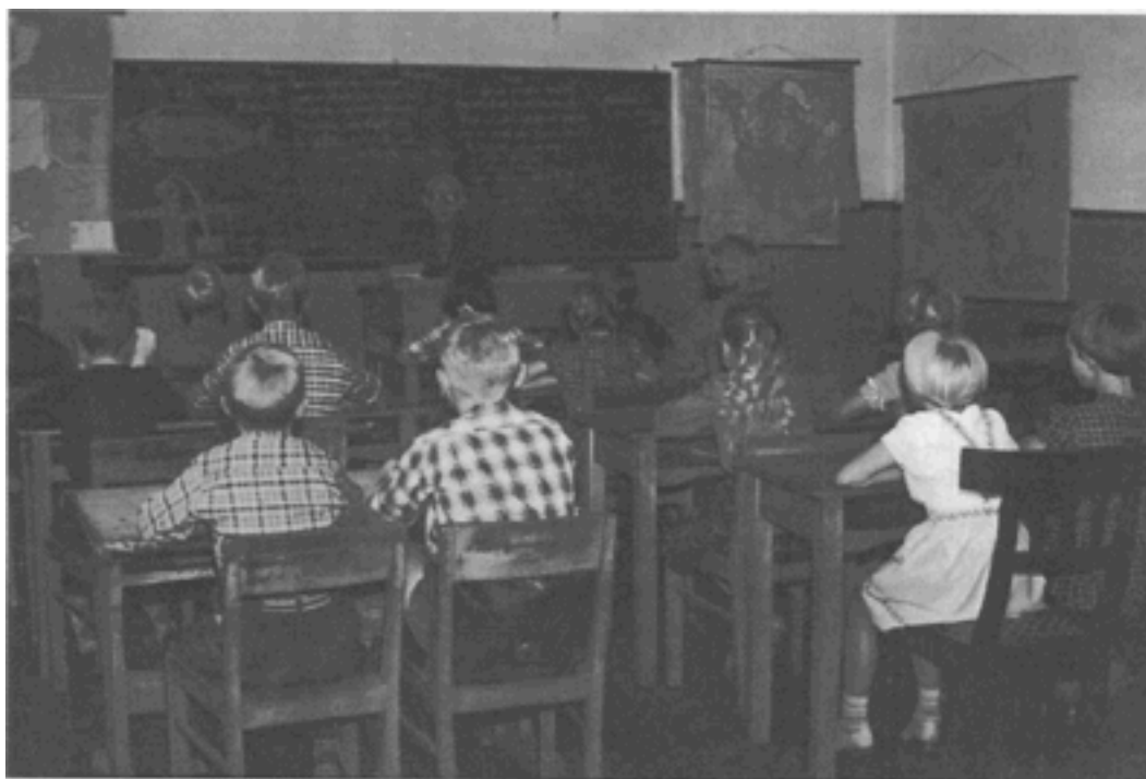
Billede fra klasseværelset i Kjelstrup gamle skole. Lærer Poulsen ved katederet

Det vil sige, at hele huset blev brugt til fest for det lille samfund, og det var uden vederlag af nogen slags.