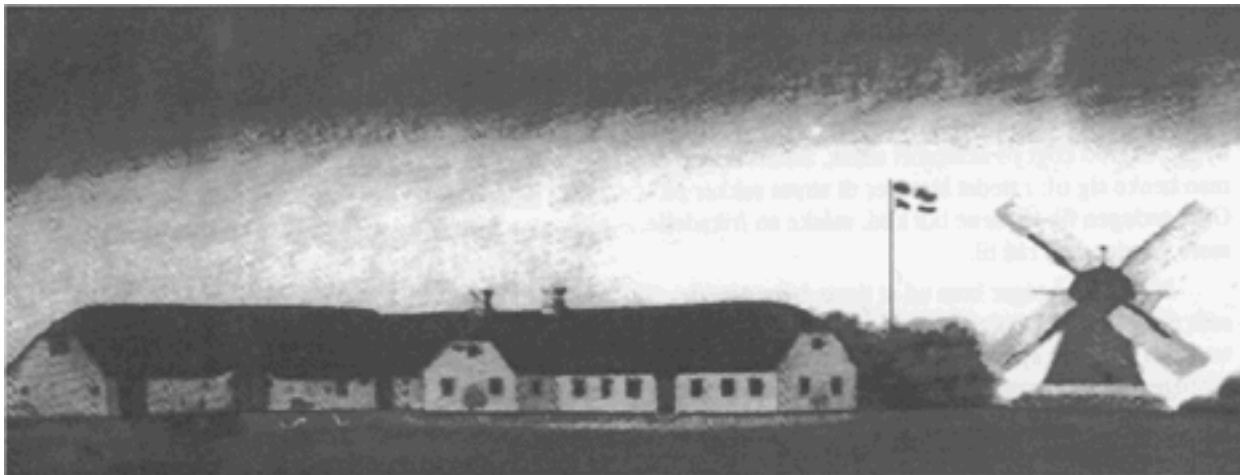
Maleri af Den gamle Brund mølle

I en tid, hvor vindmøller skyder op overalt, kunne det måske se ud som om historien er ved at gentage sig.