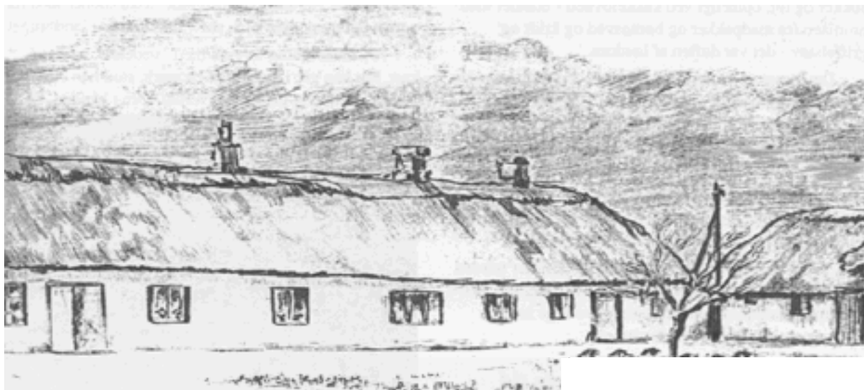
Blyantstegning af Tovsgaard 1945 af Hans Bruun Bertelsen.

Jeg er født i 1931 på Tovsgård i Skinnerup.