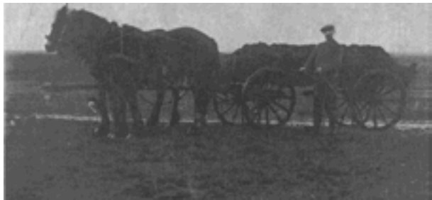
Der køres møg ud i stivvogn med et par stærke heste for. Først lægges det i dynger på marken, før det spredes ud med håndkraft for senere at pløjes ned. Alt foregik med heste- og håndkraft.