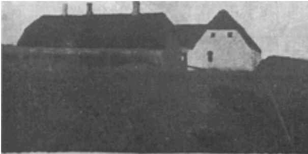
Kjelstrup fattiggård, senere omdøbt til "Stenager"