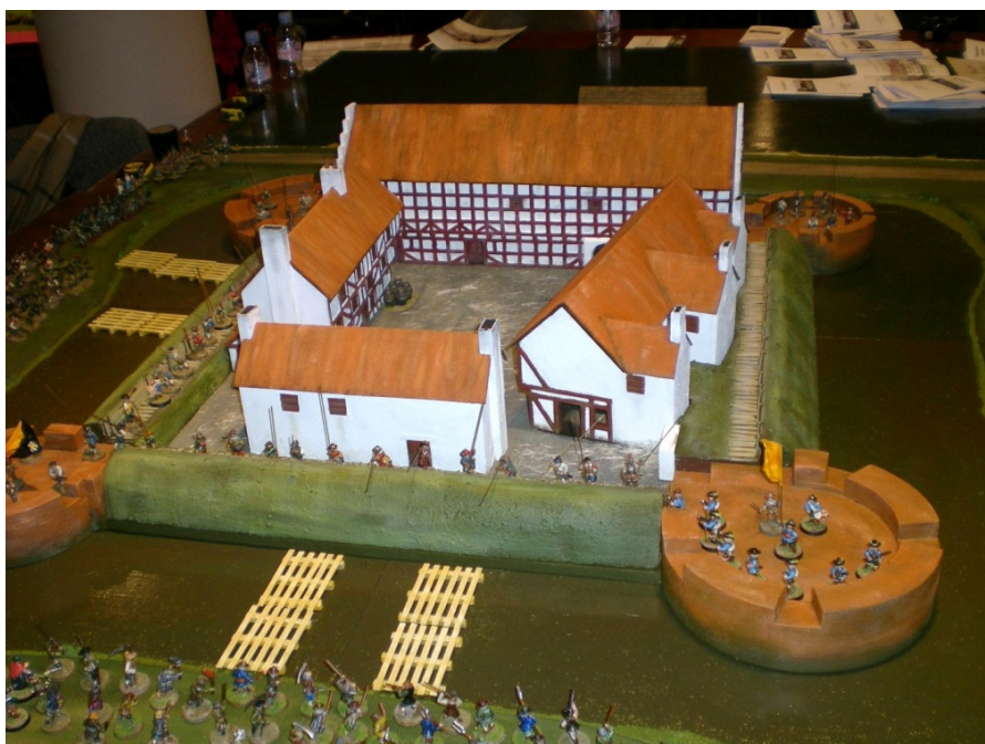
Figur 5: Aalborghuset så måske sådan ud 1644. Rekonstruktion af svenskernes belejring 1644. Foreningen Tinsoldaten, Aalborg.