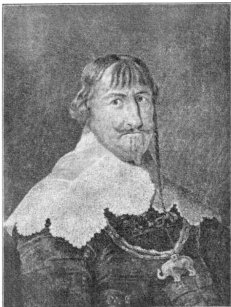
Kristian den Fjerde