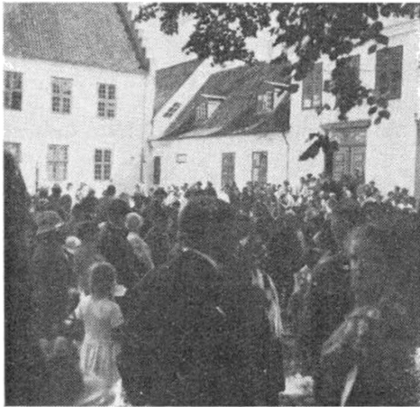
Fra Sommerstævnet paa Nr. Vosborg.