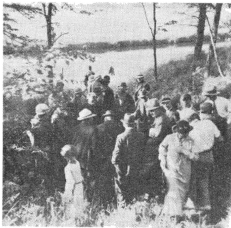
Ved Skærum Kilde.