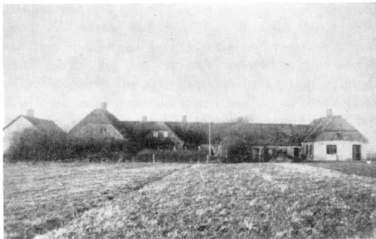
Stavning østre skole omkring ved år 1907.

Far kunne godt give en dreng en lussing, hvis han syntes, han fortjente det. Jeg tror dog ikke, nogen bar nag til far af den grund. Tværtimod har han fået mange beviser for, at hans elever agtede ham. Jeg tror, der var tre ting, der gjorde, at far blev en afholdt lærer. Det var for det første det, at han var god til