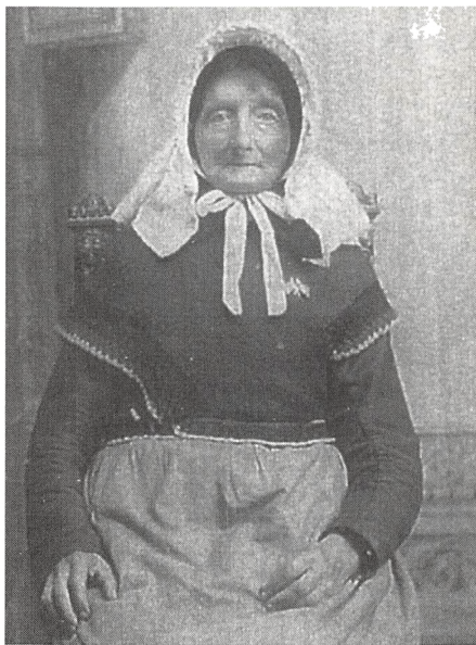
Ovenstående illustrationer vedrører indlæg nr. 88.