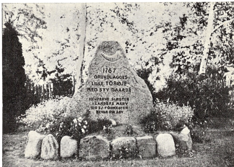
Stenen i „Byens Have“.