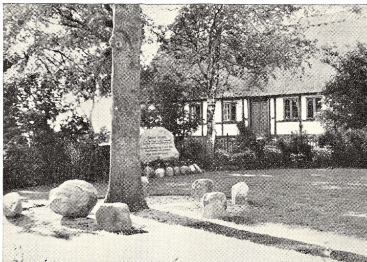
Lille Torøje gamle skole.