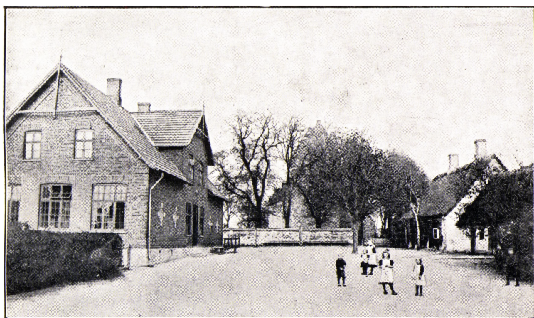
Egeslevmagle Skole og Kirkevej.