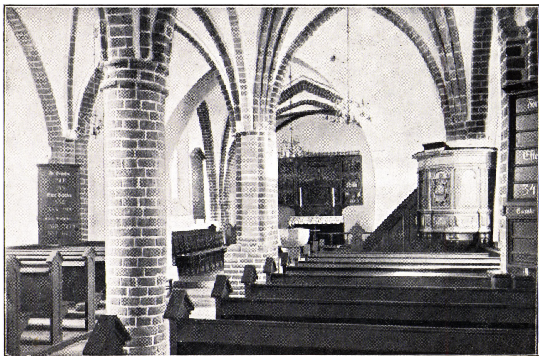
Egeslevmagle Kirkes Indre.