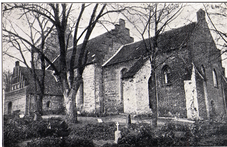
Egeslevmagle Kirkes Sydside.