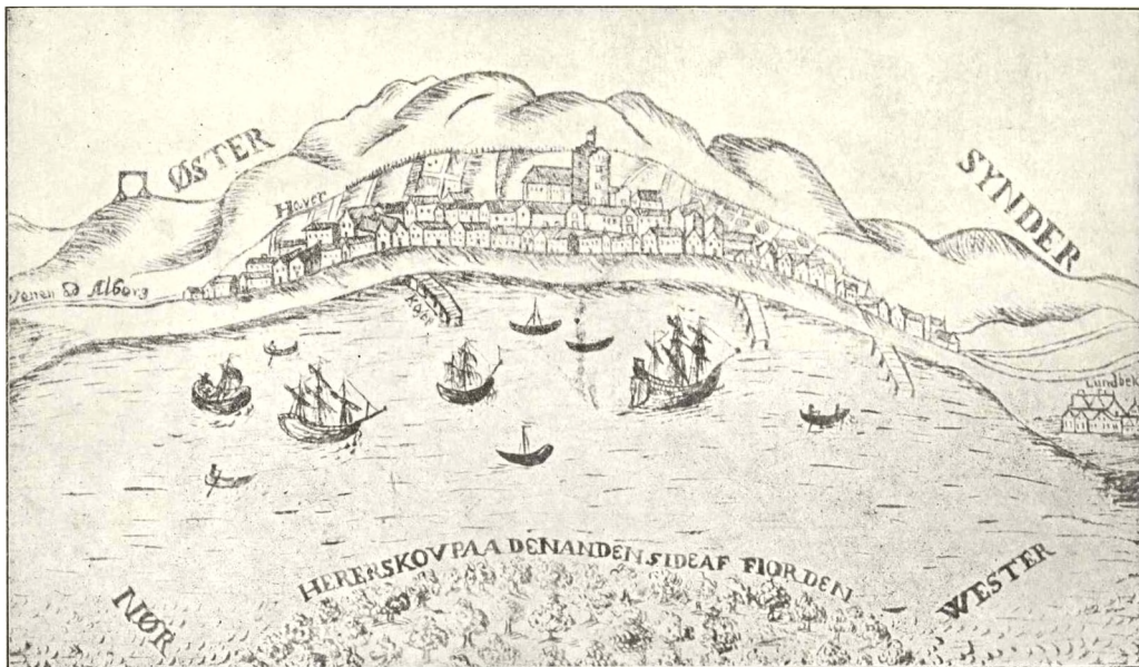
Nibe o. 1670 (efter Rescens Atlas).