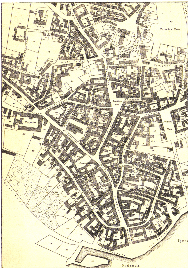
Matrikelskort over Randers 1874.