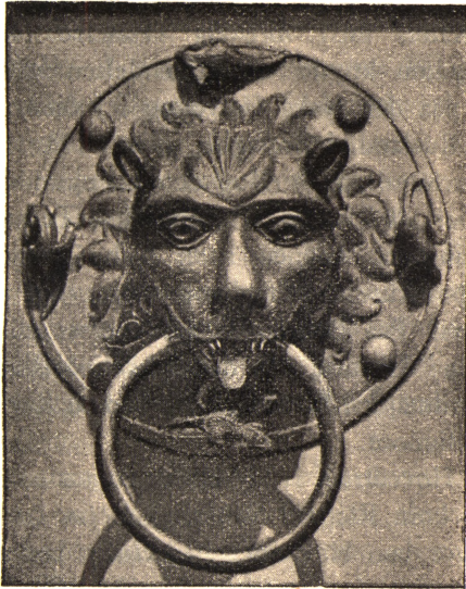
Broncepladen fra »Kathoveddøren«.