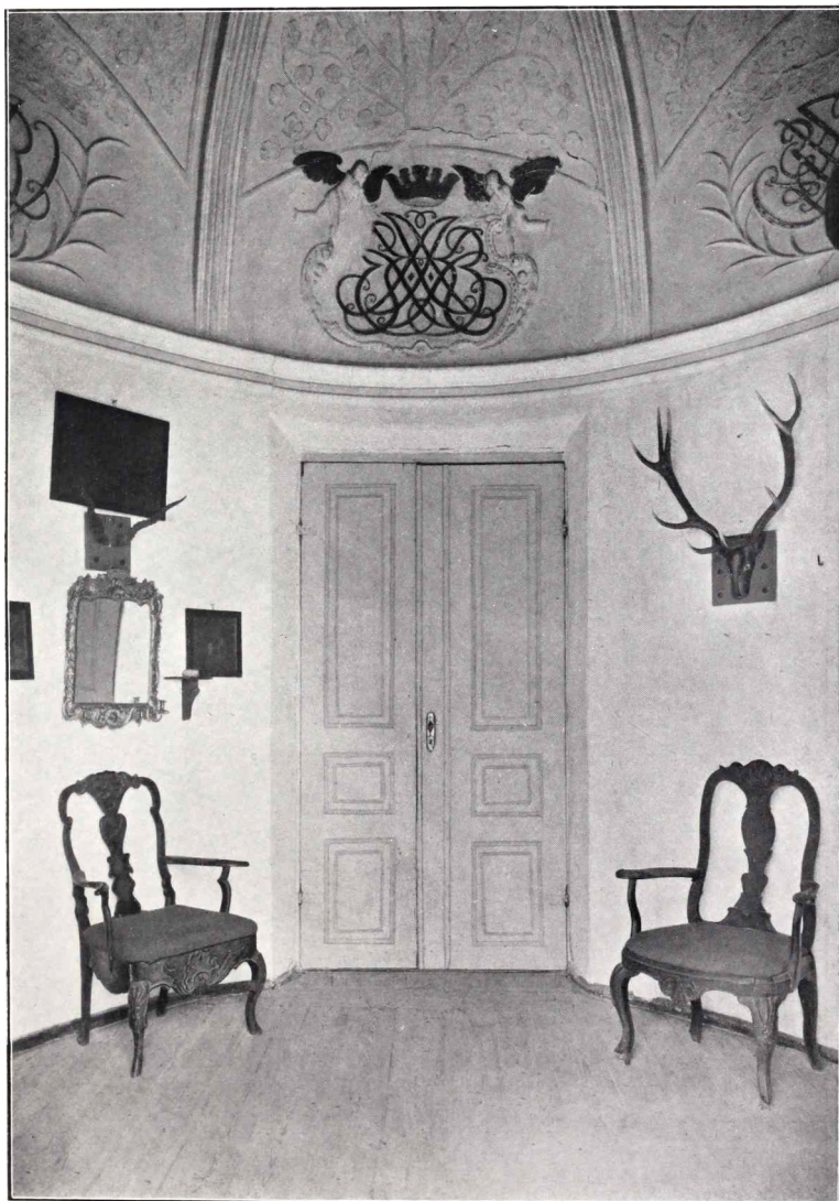
Forstue i Taarnet paa Randrup.