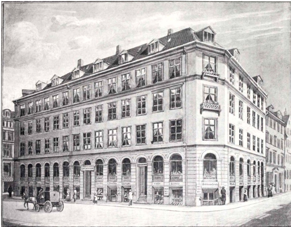
C. II. Lunds Ejendom paa Store Kjøbmagergade.