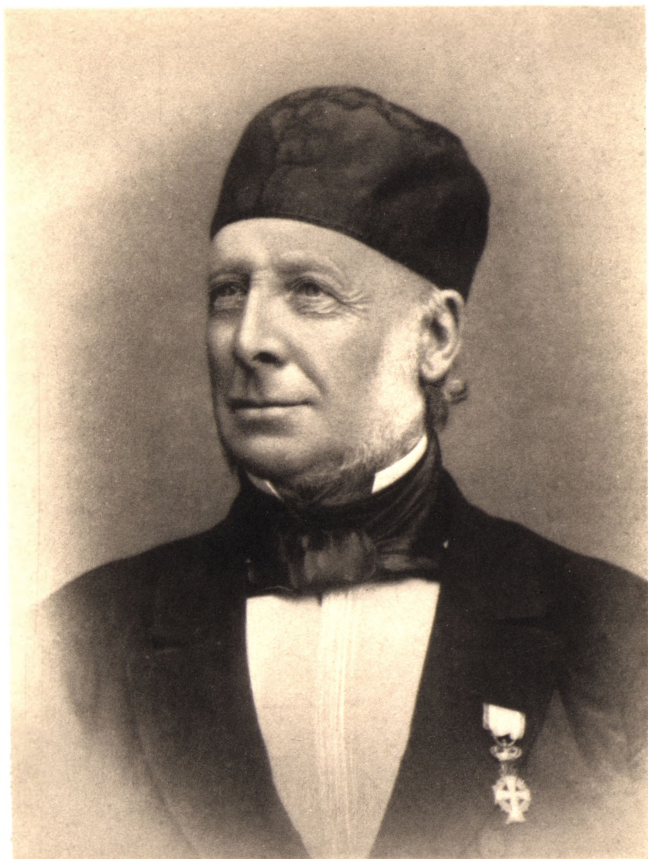
RAADMAND ADOLF BOESEN, RIDDER AF DANNEBROG, F. 1814, † 1895