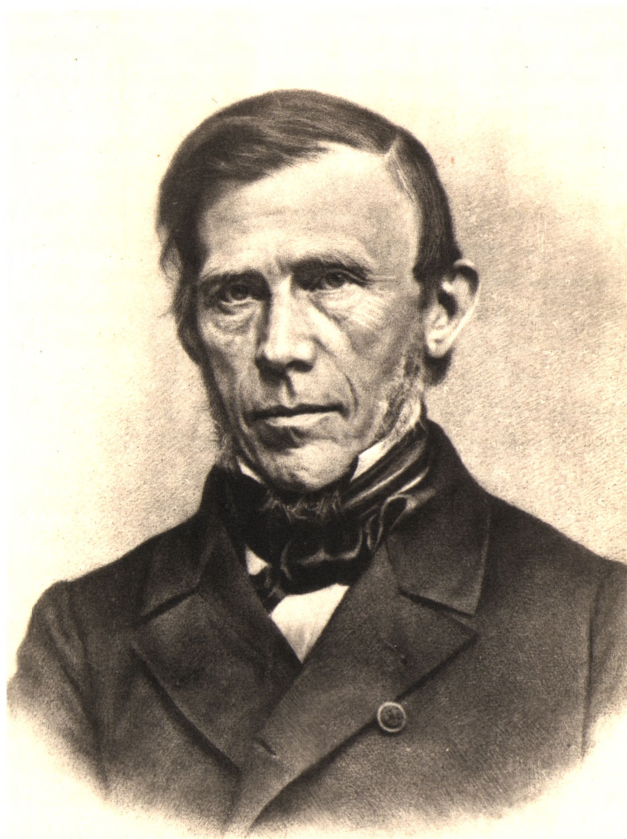
STIFTSPROVST EMIL FERDINAND BOESEN, RIDDER AF DANNEBROG, F. 1812, † 1881