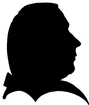
SOGNEPRÆST FREDERIK BOESEN F. 1738, † 1776