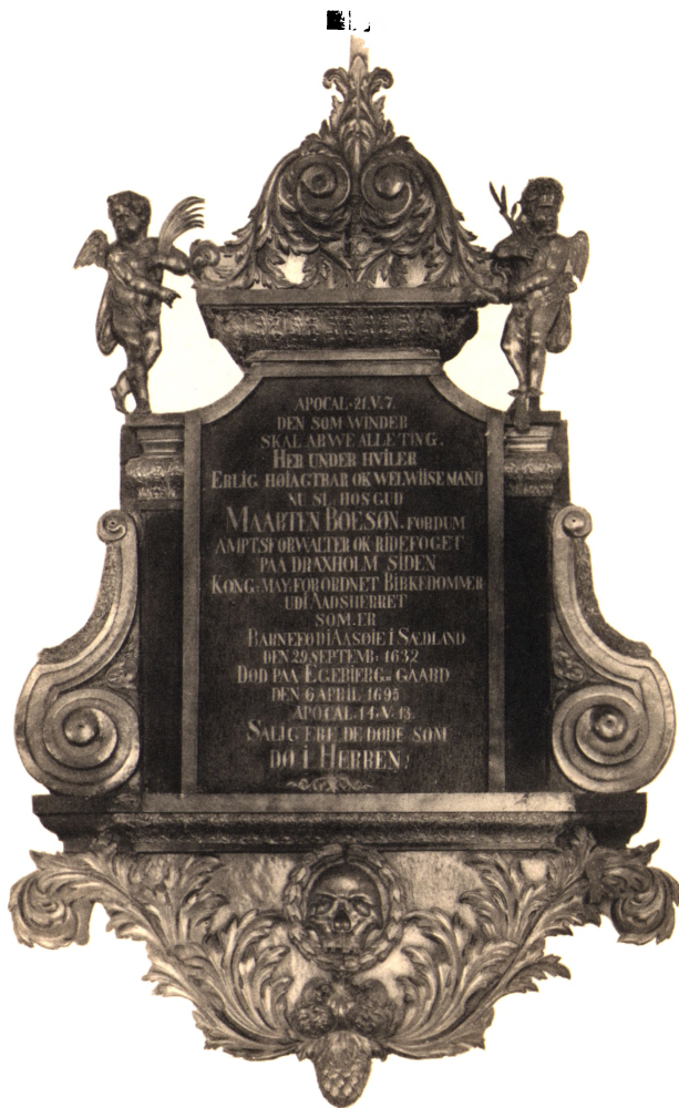
AMTSFORVALTER MORTEN BOESENS EPITAFIUM I EGBJERG KIRKE