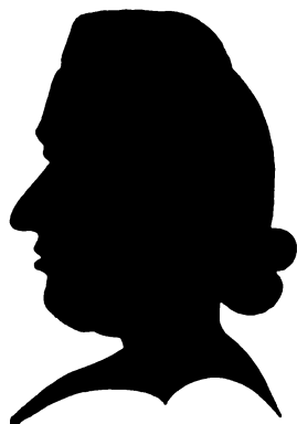
SOGNEPRÆST LUDVIG BOESEN F. 1733, † 1788