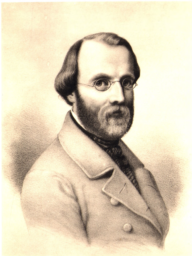
LANDSKABSMALEREN AUGUST WILHELM BOESEN, F. 1812, † 1857