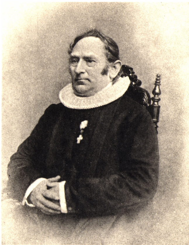
STIFTSPROVST CARL VILHELM BOESEN, RIDDER AF DANNEBROG, F. 1809, † 1867