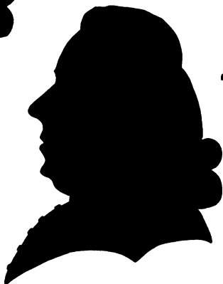
SOGNEPRÆST MORTEN BOESEN F. 1698, † 1742