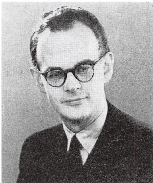
Viggo Kampmann, ca. 1945.

on. Artiklerne var i højere grad end tidligere præget af optimisme, og samtidig skete der et skift med hensyn til, hvilke emner der efterfølgende kom til at dominere bladet. Fra november 1944 rettede Danske Tjenestemænd jo især fokus mod de unationale embedsmænd og – i forlængelse heraf – mod efterkrigstidens retsopgør.