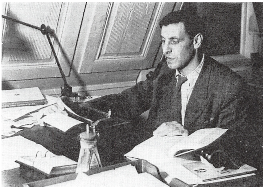
Isi Grünbaum 1946.