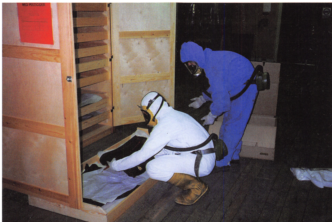
Tømning af klædeskab med hylder. Tøjhusmuseet, maj 1996.

De udstoppede heste kunne ganske vist ikke renses kemisk, men graden af pesticidforurening var til gengæld lavere. Rent faktisk havde analysefirmaet haft svært ved at finde støv nok til analyserne. Det skal her indskydes, at den hidtil anvendte metode ved prøvetagningen havde været mikro-støvsugning. Spørgsmålet var nu, om hestene egentlig udgjorde en håndteringsrisiko. For at bringe afklaring foranstaltedes en såkaldt arbejdssimule-