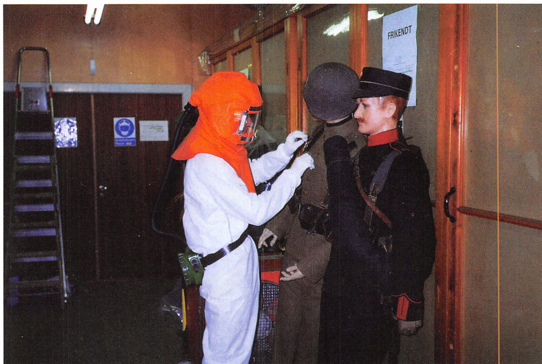
Aflædning af mannequindukker med henblik på rensning. Tøjhusmuseet, maj 1996.

gjorde det nødvendigt at afholde åben licitation i hele EU. I tilfældet med den kemiske renseopgave blev 4 renserier opfordret til at afgive tilbud. I tilfældet med den mekaniske rensning blev der via dagspressen annonceret et begrænset udbud med prækvalifikation. Blandt henvendelserne prækvalificeredes 4, som herefter blev bedt om at afgive et egentligt tilbud. Den mekaniske rensning var udbudt som to selvstændige opgaver – hhv. rensning af magasiner og genstande. De 4 firmaer, der alle var fra asbestsaneringsbranchen, bød alle på begge opgaver.