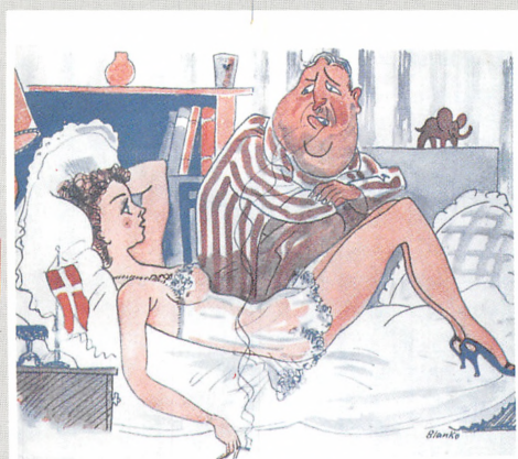
Yh. Ministeren. Kære FRIZZEMAND, det er ikke nok at have Vilgen, man skal ogsaa have Fænen.