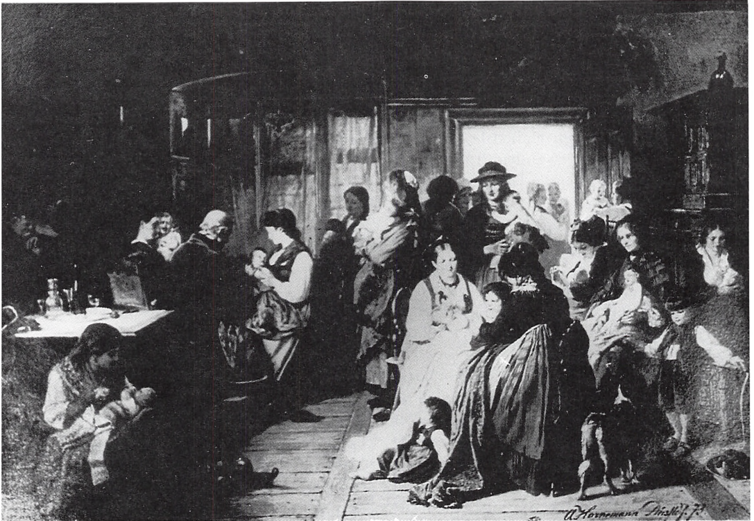
Fig. 1. Fotografi af et maleri af A. Hornemann 1873. Billedet viser en vaccinationsscene fra landet. Da vaccinationstrængen blev indført 1871 var lovforslaget oprindeligt tænkt som en liberalisering af den gældende ordning. Men stemningen ændrede sig, bl.a. som følge af aktive indlæg fra Emil Fenger og den fornyede positive interesse for vaccinationen, der var en følge af koppeepidemien i begyndelsen af 1870-erne.

domme, og de kunne begrunde tildeling af ekstraordinær kompetence til dekanus, et træk, der er gennemgående for hele 1800-tallet. 74