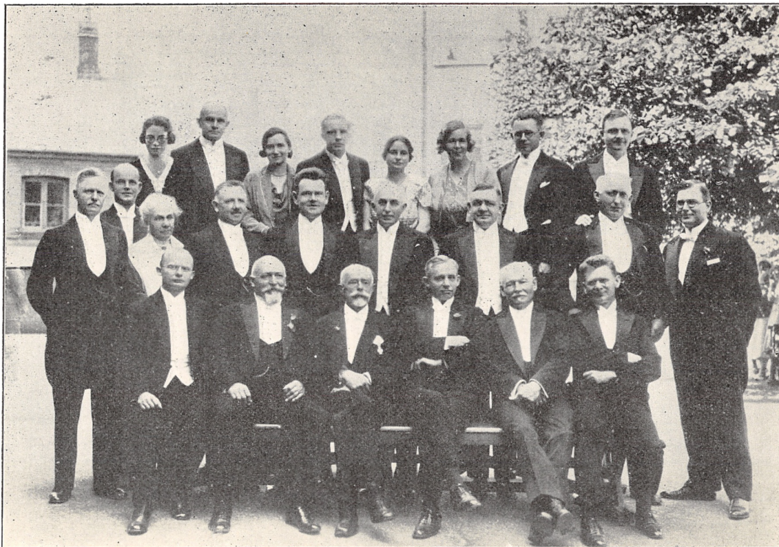
Skolens Lærere den 30. Juni 1932.