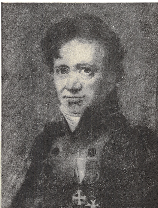
Kontreadmiral Cornelius Wleugel. Efter pastelmaleri (Privateie).

1. Cornelius Wleugel. F. i Kjøbenhavn 16. okt. 1764, blev sjøkadet i 1778, sekondløjtnant i den dansk-norske marine i 1782, premierløjtnant i 1789, kapteinløjtnant i 1796, kaptein i 1803, kommandørkaptein i 1810, kommandør i 1815, og kontreadmiral i 1828. I aarene 1788 til 1791 bistod han sin far med administreringen av orlogshavnen. 1791—94 interims-ekvipagemester,