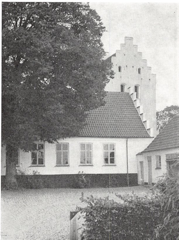
Skamstrup præstegård og kirketårn

og mere rummeligt stuehus af mursten med tegltag, hvortil han selv leverede tømmeret. Denne bygning benyttes den dag i dag, mens udlængerne måtte nedrives for et par år siden.