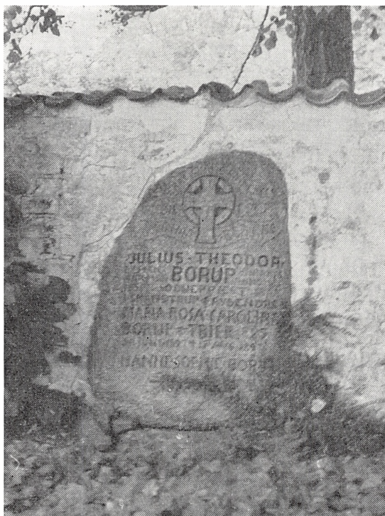
Gravstenen i Skamstrup