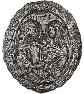
Fig. 5. Aftr. af Kageform. 166.

af de engelske Fajancer, som var de seneste danske Fabrikkers Forbilleder, er der især erhvervet en Del Exemplarer med paatrykte danske Prospekter, navnlig et Kaffe- og Testel med københavnske Billeder, fabrikeret af Sewell c. 1825. Lidt yngre er et Fad med »East view of the town Charlotte Amalie in the island of St. Thomas« samt et Par Tallerkener med Billeder af »Mr. Kjær's residence & observatory«, sikkert ligeledes paa en af de tidligere dansk-vestindiske Øer.