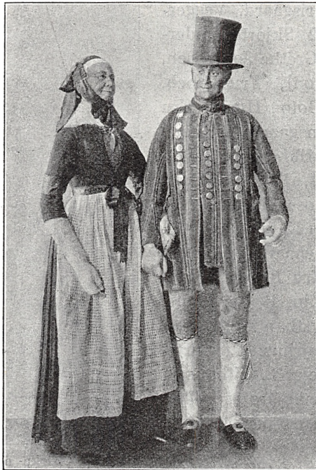
Fig. 10. Mands- og Kvindedragt fra Rosnæs.