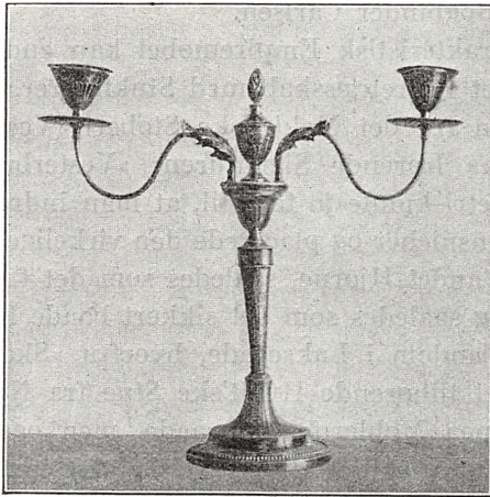
Fig. 3. Sølvvarmstage. København 1790.

Af andre Sølvmedearbejder er der erhvervet adskilligt Bordtøj. Sølvbeslag har en Pibekande af Træ, et Bødkerarbejde med udskaarne, slyngede Navnetræk fra Tiden c. 1700, maaske gjort i Norge, men sidst kommende fra Faaborg. Et Sølvbæger med graverede Barokblomster bærer københavnske Stempler fra 1709 (Mester: Villads Frandsen), et Sølvlaag er ligeledes københavnsk Arbejde, fra 1746 (Mester: Axel Krøyer). Hovedstadsmærker har