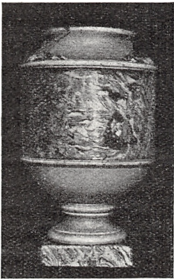
Fig. 6. Potpourrivase af Kastrup Fajance.