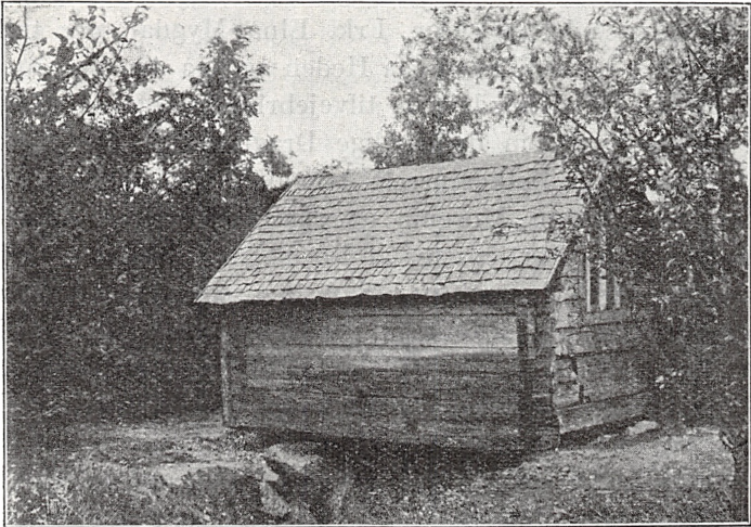
Fig. 1. Skvætmølle fra Åhylte.

Hvad Frilandsmuseets Bygninger angaar, har Rejserne ikke tilført Frilandsmuseet større Erhvervelser. Prisforholdene har jo været lidet gunstige for Indkøb og Flytning af større Bygninger.