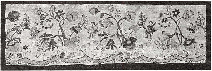
Fig. 7. Uldgarnsbroderi paa Sengetæppe i Rococostil.