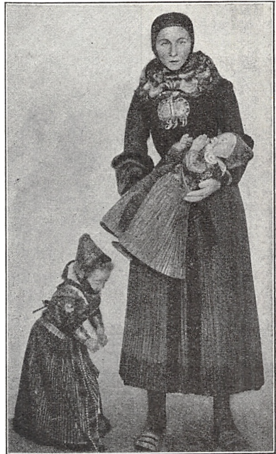
Fig. 9. Kirke- og Barnedragt fra Hollandsk Amager.

Fra Fyn og fra Nørrejylland er der kun indkommet ganske faa Dragtdele, hvoriblandt kan nævnes en »Chenille« (Mandsverfrakke med Slag) af mørkeblaat Vadmel fra Lem og flere andre Dragtstykker fra Salling. I Sønderjylland er der, atter takket været Undersøgelsesrejserne, gjort en rigere Høst, især paa Løjt-