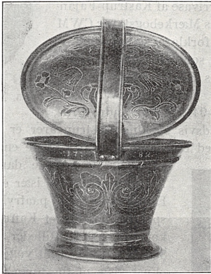
Fig. 4. Torvespand af Messing. 1782.

Blandt andre Bord- og Køkkensager kan fremhæves en større Samling Køkkentøj af Kobber og Tin, stammende fra Herregaarden Gammel-Estrup, samt flere enkelte Genstande: en nydelig,