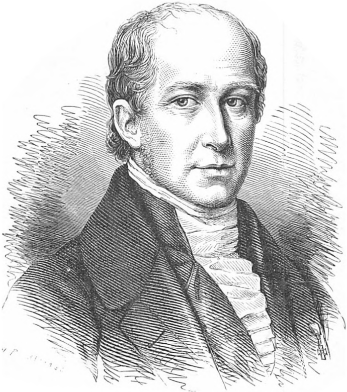
Lensgreve F. A. Holstein til Holsteinborg.