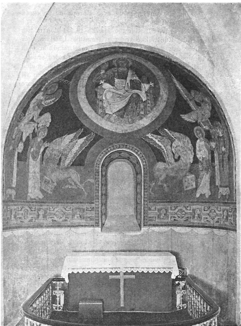
Kalkmaleri i Apsis. Alsted Kirke. Omtrent som i Broby, men bedre bevaret.

(Klicheen til ovenstaaende er laant fra Værket »Danmarks Kirker«.)