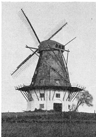
Skovsgaards Mølle i 1941.

ranke Skoves Baggrund. Rosted Mølle, der ogsaa rejstes som Afløser af en kgl. Vandmølle, er nedbrændt. Skovsgaards Mølle drives ikke mere, og dens forhen stolte Præg er nu vemodigt. De har haft deres Tid.