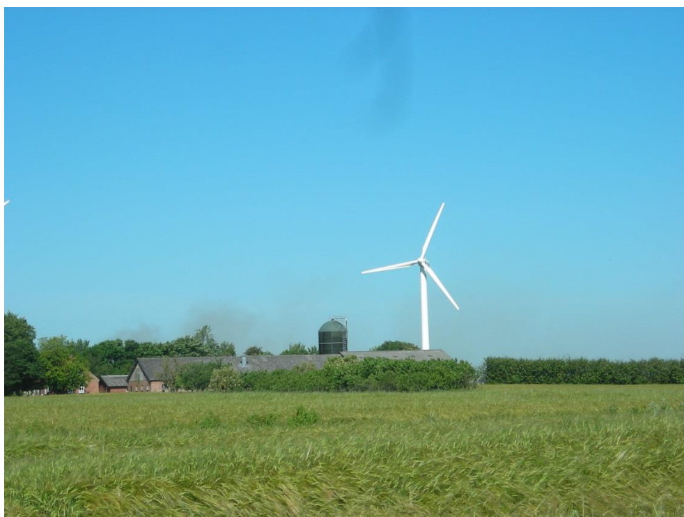
Moesgård set fra Øster Kirkevej - juli 2015

Tømmer fra den gamle gård blev genbrugt. I dag er Moesgård et landbrug på ca. 40 hektar.