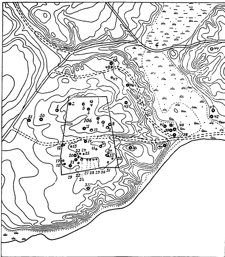
Højene paa Ydby søndre Hede og de nærmeste Omgivelser. Den sorte Linje angiver den omtrentlige Grænse for det fredlyste Areal.

laa en Dolk af Bronze. Det kan da antages, at de mægtige Høje først gennem flere Gravlægninger har faaet deres store Dimensioner.