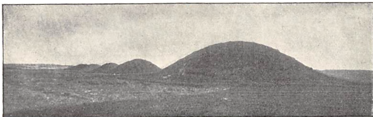
Høje paa det fredlyste Areal.

Om de store Høje haves nogle fra forskellige Kilder samlede Oplysninger, der tyder paa, at de stammer fra Stenalderen og Bronzealderen. Saaledes skriver Lærer Kjær om en Langhøj, utvivlsomt Kortets Nr. 33: „For nogle faa Aar siden blev samme Høj aabnet i dens sydvestre Side og der fandtes en meget stor Gravkjelder [herved maa forstaas et Kammer af store Sten], omsat