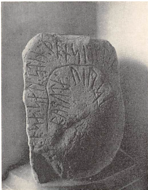
Sjørind-Stenen 1) .

Samtidig med, at Skonvig i Tvorup Kirkes