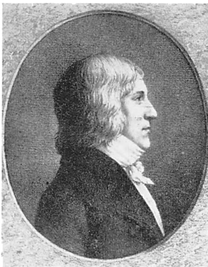
MALTHE CONRAD BRUUN ( efter Birkedahl-Barfods Bog )

Forbillede. Mange af hans lyriske Digte fra den Tid er skønne Perler i den danske Litteratur. Man maa ikke dømme Malthe C. Bruun for haardt, han var jo som mange andre unge præget af Tidens Tanker, men han var i Besiddelse af et ungdommeligt Overmod, som blev misforstaaet af Samtiden. Den kendte Digter Knud Lyhne Rahbek skriver om ham, at han var Elskværdigheden selv og besjælet af Varme for alt ædelt og godt.