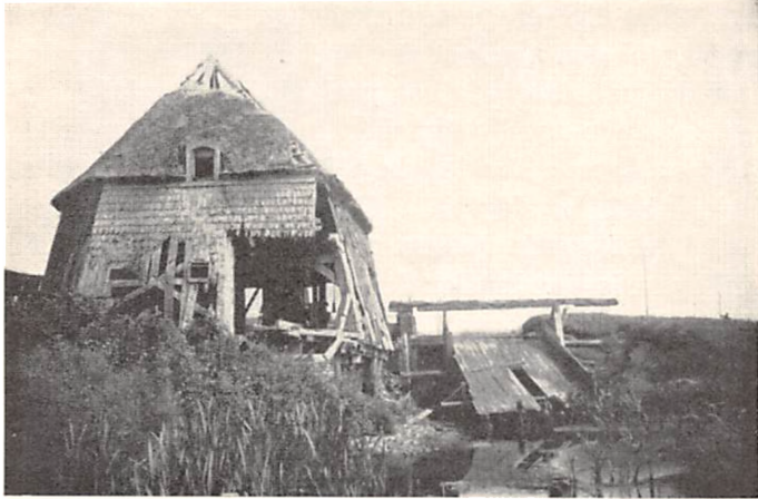
Vestermølle i Klitmøller, som faldt sammen i Efteraaret 1938.