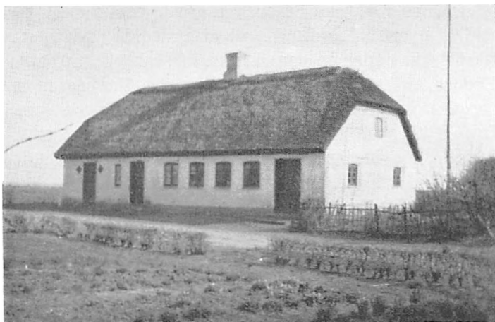
Skjoldborgs Hjem i Skippergade, Øslos.

denne Fremgangsmaade fik han sin Jord saaledes forbedret (Muld kørt ned fra Bakken paa en Sig), at han fik flere Præmier som dygtig Husmand 1 ). Naar Johan Skjoldborg godt vilde gøre sig til af, at han var Søn af en Præmiehusmand, er dette altsaa saa som saa. —