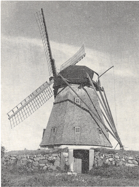
Den gamle mølle i Gullerup