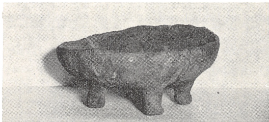
Den sjældne lerskål fra graven hos Vald. Steffensen, Skærbæk

Hos Peder Mortensen, Tøving, har man undersøgt en overpløjet høj, i hvilken der var 5 grave, deraf var de 2 meget velbevarede, de 3 mere eller mindre beskadiget. Alle grave var sat af træplanker, der dog var helt formuldet. I den bedst bevarede grav var der 21 ravperler, hvoraf nogle små benævnes som hængesmykker. Grav 2 indeholdt et lerbæger med smukke ornamenten. I de 3 andre grave var der intet gravgods. Gravene må henregnes til begyndelsen af bronzealderen.