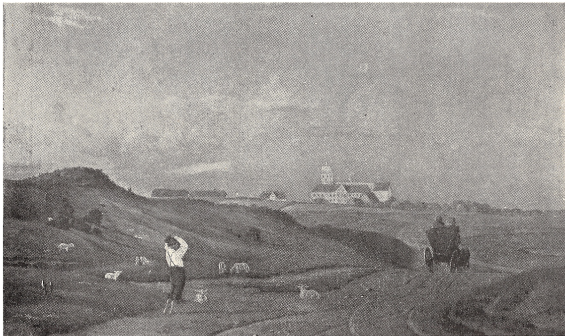
Vestervig Kloster 1830. Maleri af C. Dahlsgaard efter Akvarel af Rørbye.