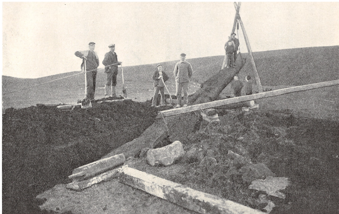
Fra Fortidsskove i Thy.

47 Fod lang Egestamme opgravet 1906 i Engen ved Landlyst ved Thisted. — En 24 Fod lang Gren optoges samtidig.