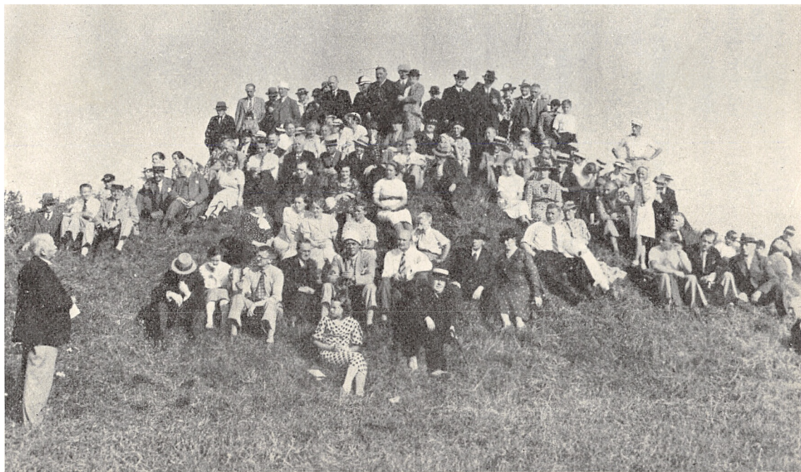
Udflugtsdeltagerne samlede ved Vestervig Høje.