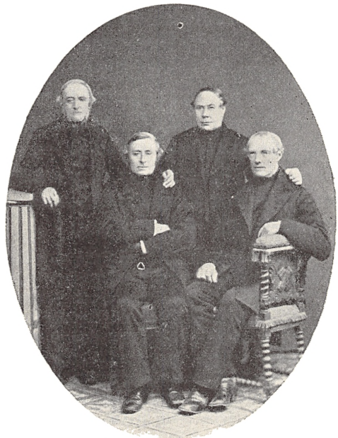
De fire Kirkeældste.