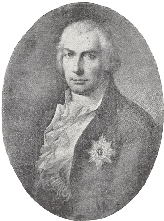
Greve Christian Ditlev Reventlow til Christianssæde (1748–1827). Malet af Hans Hansen. Pederstrup.