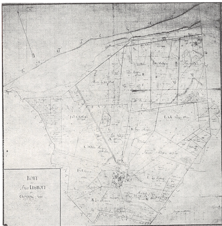
Udskiftningskort over Udsholt by i Blistrup sogn. Udskiftet 1786. Kombinationen af stjerne- og blokudskiftning er typisk for fremgangsmåden ved de nordsjællandske landsbyers udskiftning.

den, på kortet området i nord begrænset af kystlinien og linien fra S til T, udlægges til et fælles overdrev. Landvæsenkommissionen mener dog, at de lodder, som får længst til overdrevet,