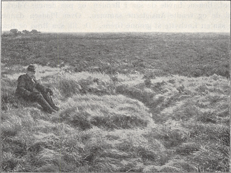
Fig. 1. Pinsebod i Paabøl Hede, Nr. Horne Herred.

Udførligere Oplysning om Pladsens Udformning giver følgende Beretning: »En gammel Mand i Lørslev (Ugilt Sogn, Vennebjerg H.)