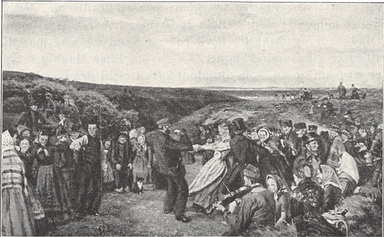
Fig. 2. Hans Smidths Maleri: Pinsefest paa Heden.

Vi skal nu betragte en anden Form for Gildespladser i Fri-luft, de af Diger indfattede Dansepladser. Ogsaa disse kan det være vanskeligt at tyde, naar man træffer dem ude i Terrainet, og de forveksles let med gamle Folde, ligesom man vel ogsaa