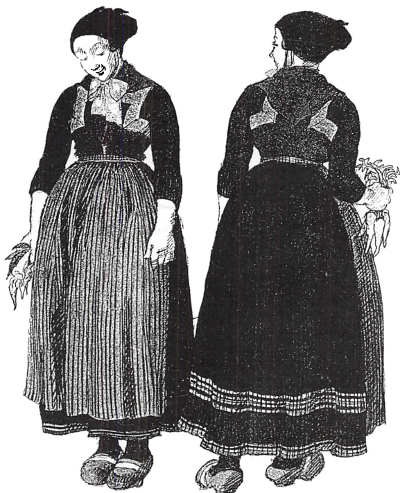
Hverdagsdragt med mørkegrøn Bort fra Røsnæs.

Indhæftet midt i bladet findes program og tilmelding til 5. SLÆGTSFORSKERDAG LØRDAG DEN 20. SEPTEMBER 1997