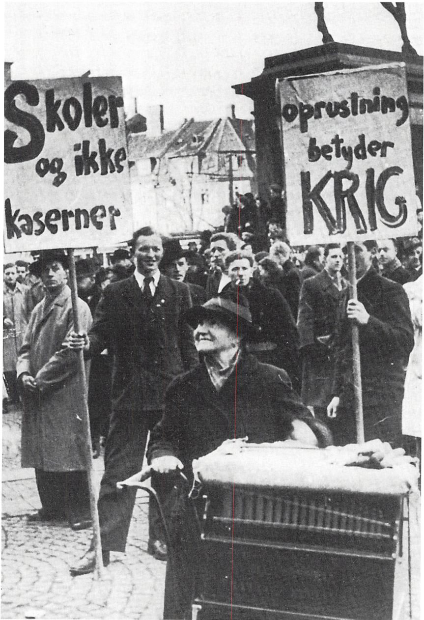
Demonstration på Christiansborg slotsplads i marts 1949 under Rigsdagens behandling af lovforslaget om Danmarks tilslutning til NATO. (Nordisk Pressefoto. Her efter Poul Hammerich, Danmarks Krønike, bd. 2, s. 34).