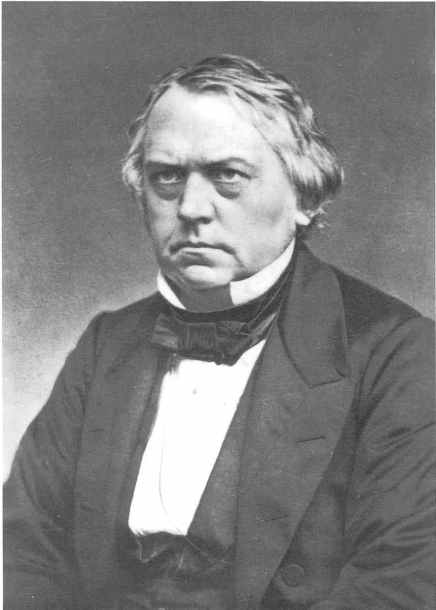
D.G. Monrad 1861. Kombinationen af viljestyrke og evne til refleksion var karakteristisk for Monrad. Dette foto af den 50-årige, noget dystert udseende mand med de stærke øjne og det bestemte drag om munden synes ikke at dementere disse egenskaber. Tværtimod får man indtryk af en mand, der ville have sin vilje, og som ofte fik det. (Billedsamlingen, Det kongelige Bibliotek).