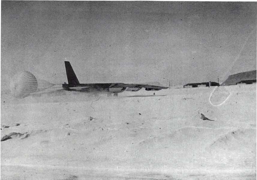
Amerikansk B 52 bombemaskine fotograferet under nødlanding på Thulebasen 1967.

te have ønsket det. USA's regering var også medspiller og ville næppe tøve med at lægge pres på den danske regering, hvis den anså offentliggørelse for uhensigtsmæssig af politiske eller strategiske årsager. Den amerikanske åbenhed i Thule-sagen er et post-koldkrigs-fænomen, som man ikke naivt skal tilbagediskontere til konfliktens højspændingsperiode. Det intrikate i situationen i dag er jo, at selv om det er amerikansk arkivåbenhed, som har fremprovokeret Thule-sagen, var og er det fortsat amerikansk politik hverken at afkræfte eller bekræfte konkrete anlægs eller enheders eventuelle atombevæbning.