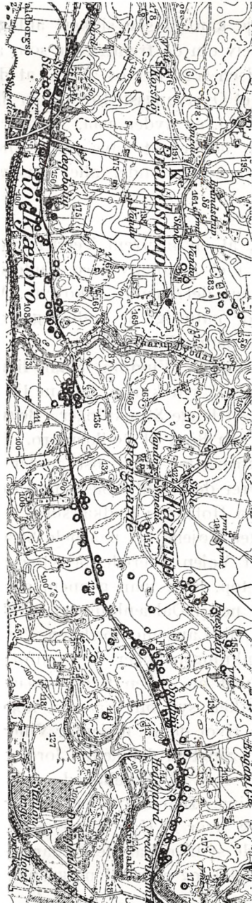
Fig. 3. Faarup, Vindum S., Middelsom H.

eller nærmere liggende — Bebyggelse findes ikke. Endvidere er Stedet her det eneste paa hele den c. 15 km lange Strækning fra Rind Bro til Bjerring, hvor Vejen har krydset et Bækløb. Det er naturligt, at dette far har givet Navn til Bebyggelsen, som Tid efter anden er vokset op i dets Nærhed. Den kan være kaldt *þorp at fari , indtil Stednavnet paa et eller andet Tidspunkt er fæstnet i dets nuværende Form.