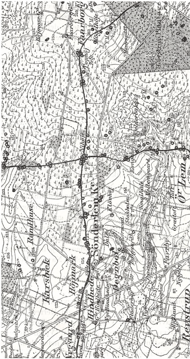
Fig. 2. Faaborg, Bølling H.