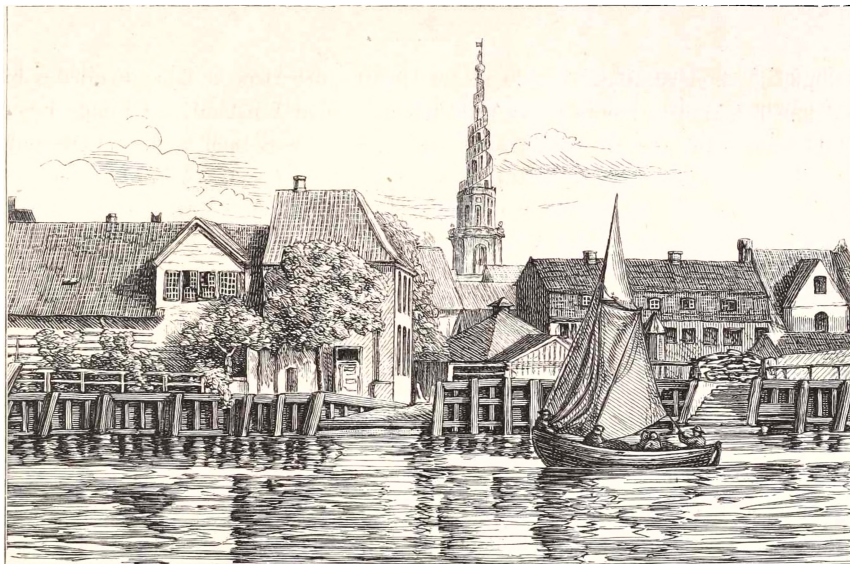
Dokken paa Christianshavn.