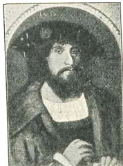
Christiern d. 2. 1514. (Nationalgalleriet, København.)

At det ikke har været nogen ganske lige og let Sag at iværksætte, derpaa tyder de langvarige Forhandlinger, som førtes derom, forinden det lykkedes at bevæge et nogenlunde tilstrækkeligt Antal Hollændere til at flytte hertil. Allerede 1515 — siger Arild Hvitfeldt — lod Kongen forhandle derom og om Foraaret 1516 skal nogle være komne, dog sikkert kun for at tage Forholdene i Øjesyn, thi endnu 1518 og 1520 ses