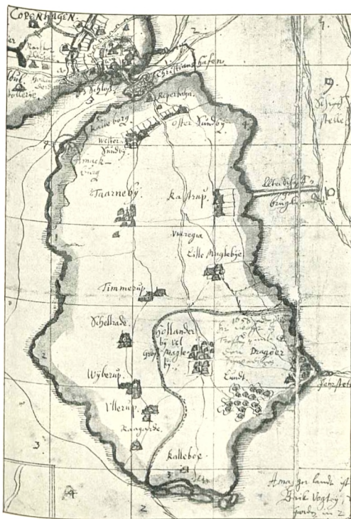
Det ældste Kort over Amager. Af Joh. Meijer. 1656. (Gl. Kgl. Saml. i det Kgl. Bibl.)