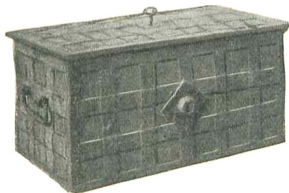
Hollænderbyens gamle Bykasse.

mellem Interessenterne. Hollænderbyen var, i Modsætning til de andre Byer, en lykkelig og velsitueret By.