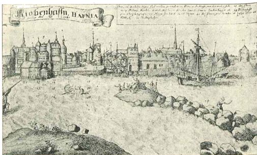
Amager Bro for Chr. d. 4.s Tid.

Af Broer , som førte til Staden, fandtes fra Begyndelsen af kun den gamle Amagerbro, egentlig en Færgebro, en lang