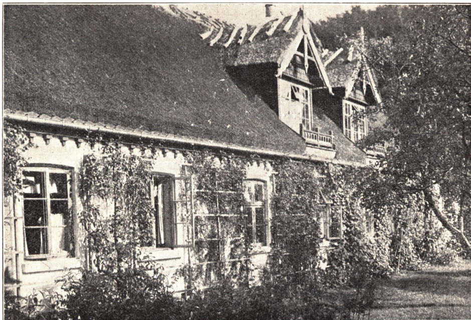
Kirkely set fra Haven.