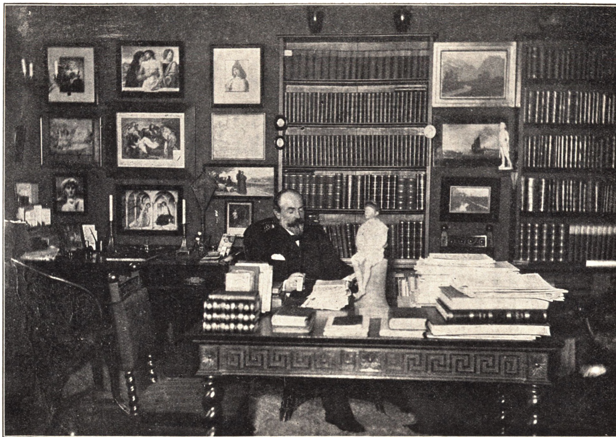
Præsten i sin Stue.