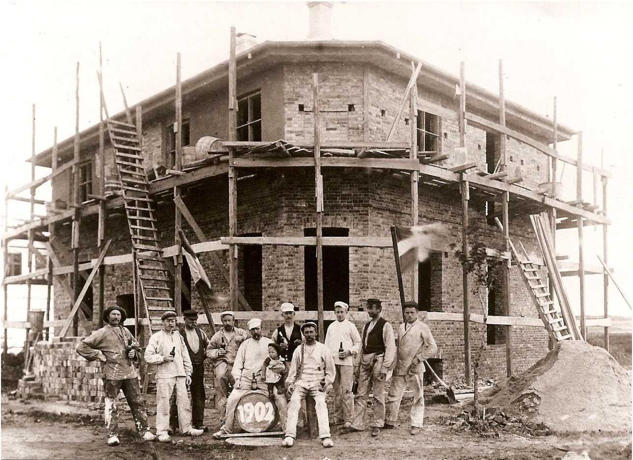
Forfatterens morfar som nr. 4 fra højre under opførelse i 1902 af en endnu eksisterende ejendom – oprindeligt som købmandsbutik – på hjørnet af gaderne Frem og Peter Rørdamsvej i Lyngby.