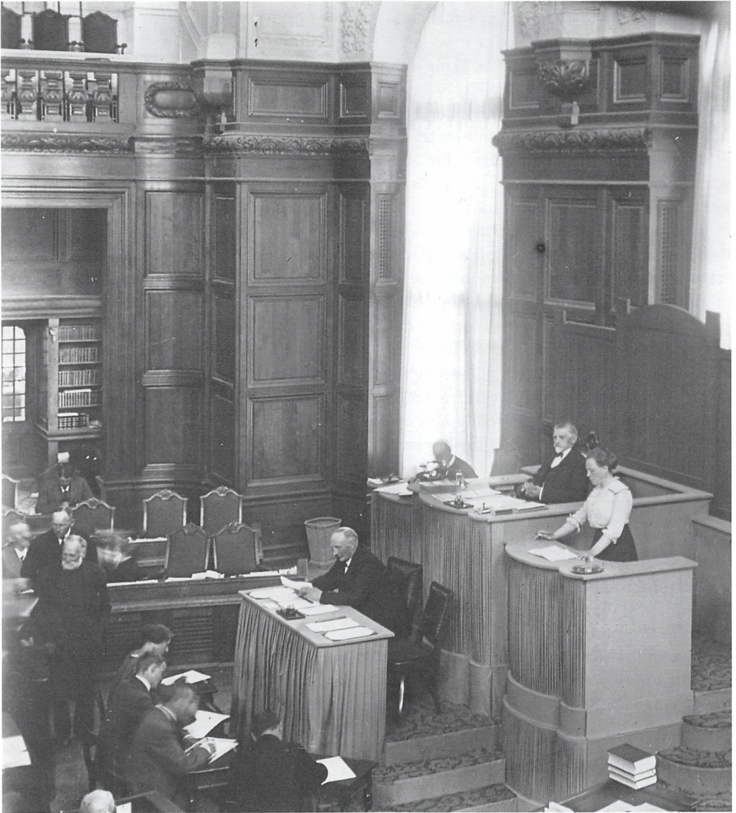
Fig. 5. Elna Munch på Folketingets talerstol 17. juni 1918. Elna Munch, der havde været en af drivkræfterne for kvindernes valgret, blev valgt til Folketinget i 1918 for Det Radikale Venstre. Kvindemuseet i Danmark, Århus.

en økonomisk afhængig placering som husholdets leder. Samtidig betød ejendomsbegrebets omdefinering til kompetencer, at der blev skabt en idé om en anden form for ydelse og pligt over for