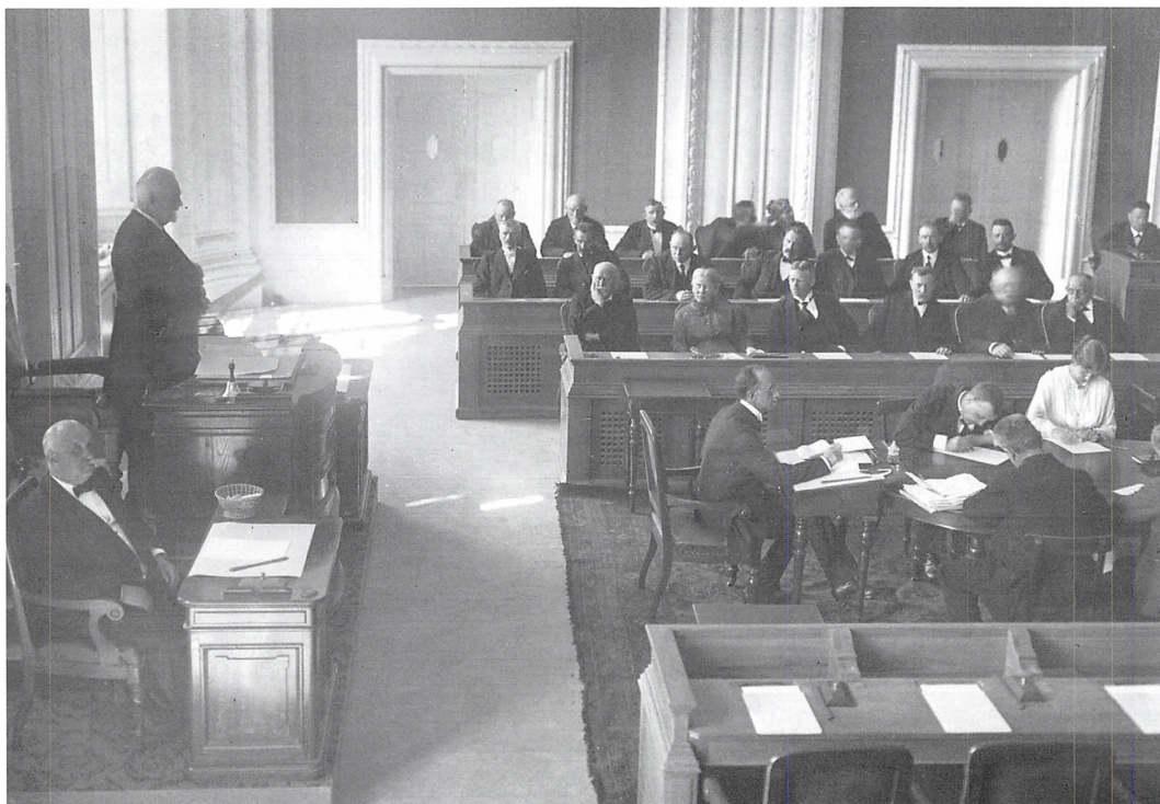
Fig. 4. Landstingssalen 28. maj 1918 ved åbningsmødet. I alt blev fem kvinder valgt til Landstinget i 1918. Kvindemuseet i Danmark, Århus.

dighed og skattebetaling, men også ud fra en maskulinitetskonstruktion, der kendetegnede de radikale kræfter i Venstre og Socialdemokratiet. Her blev kvinden med udgangspunkt i hendes særlige kompetencer betragtet som en ligeværdig medborger med krav på ligeværdig behandling. Begge kønskonstruktioner havde givetvis udgangspunkt i det levede livs praktiske erfaringer på forskellige sociale niveauer. Fælles for dem var opfattelsen af de kvindelige kompetencer som særlige og forskellige fra de mandlige; hvad enten disse kvindelige kompetencer så var naturlige eller kulturelt opøvede og gav anledning til inkludering eller ekskludering fra det politiske medborgerskab.