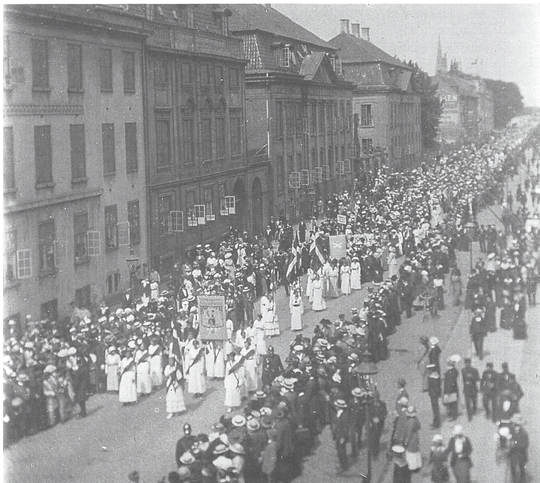
Fig 3. Kvindetoget til Christiansborg 1915. Kvindetoget i anledning af grundlovsændringen i 1915 var medvirkende til at manifestere billedet af den kvindelige valgret som det væsentligste element i den nye valgret. Kvindehistorisk Samling, Statsbiblioteket, Århus.

de pligter, blev inkluderet på lige fod, og en, der inkluderede dem med flest pligter mest og i samme bevægelse ekskluderede fra fuldt politisk medborgerskab på socialt grundlag. Ingen stillede dog spørgsmålstegn ved, at modtagelse af fattighjælp betød tab af valgret; man kunne således ikke både være nydende, dvs. afhængig, og have rettigheder. Rettighederne fulgte af det, man ydede til