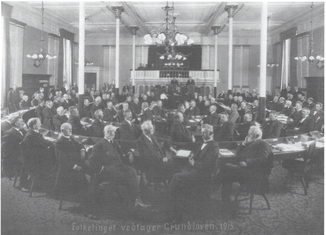
Fig. 2. Folketinget vedtager Grundloven 1915. Et flertal af mændene i denne forsamling havde på tidspunktet for grundlovsændringen været villige til at udstrække valgetten til deres kvindelige medborgere i godt 25 år. Kvindemuseet i Danmark, Århus.

platform for at kræve rettigheder. Derfor blev defineringen af omfanget og arten af de for rettigheder nødvendige pligter en central kampplads. Kampen om at definere medborgerskabets pligter bevægede samfundet fra den privilegerede valgrets sociale prioritering i inkluderingsstrategien mod en situation, hvor pligten som princip frem for pligtens omfang bestemte inkluderingen. Det var fortsat ekskluderende at modtage fra samfundet, dvs. at fattighjælpsmodtageren var ekskluderet. De følgende afsnit vil desuden vise ekskluderingen på køn og civilstand. Inkluderingen af flere sociale grupper førte til en debat om samfundets formål og et opgør med tanken om,