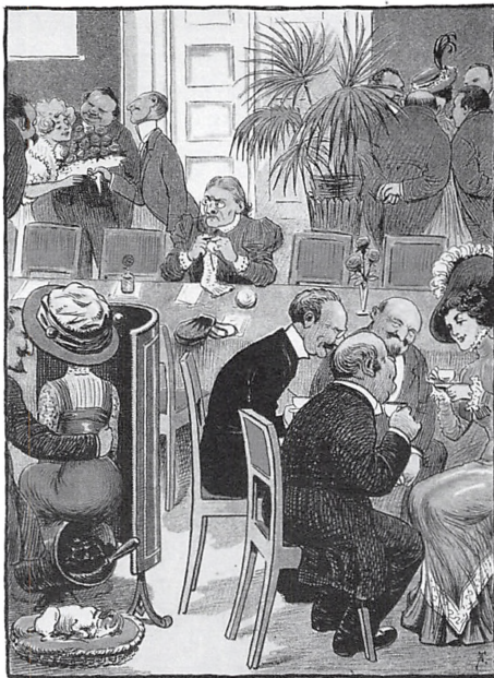
Lukket Bysrådsmede (Efter at Kvindernes Valgret er gennemført) Tegnet af Axel Thomsen

♦ ♦ D. 21. MARTS 1909 ♦ ♦ 102. AARG. NR. 28 ♦ ♦