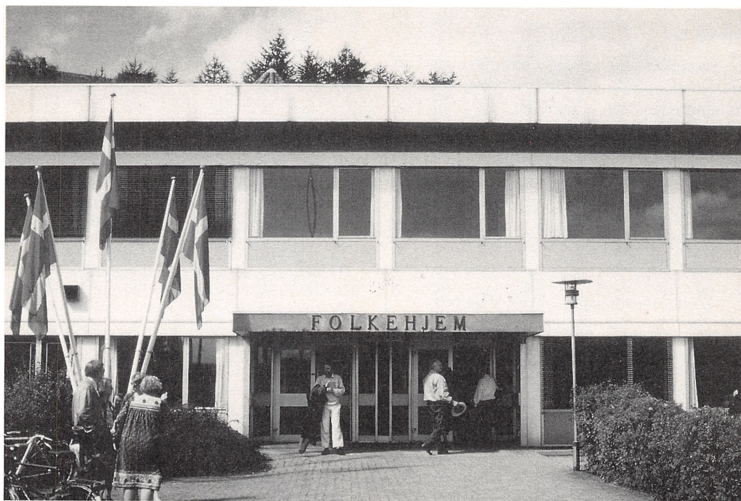
Med vajende faner blev deltagerne modtaget på Folkehjem i Åbenrå til årsmødet.