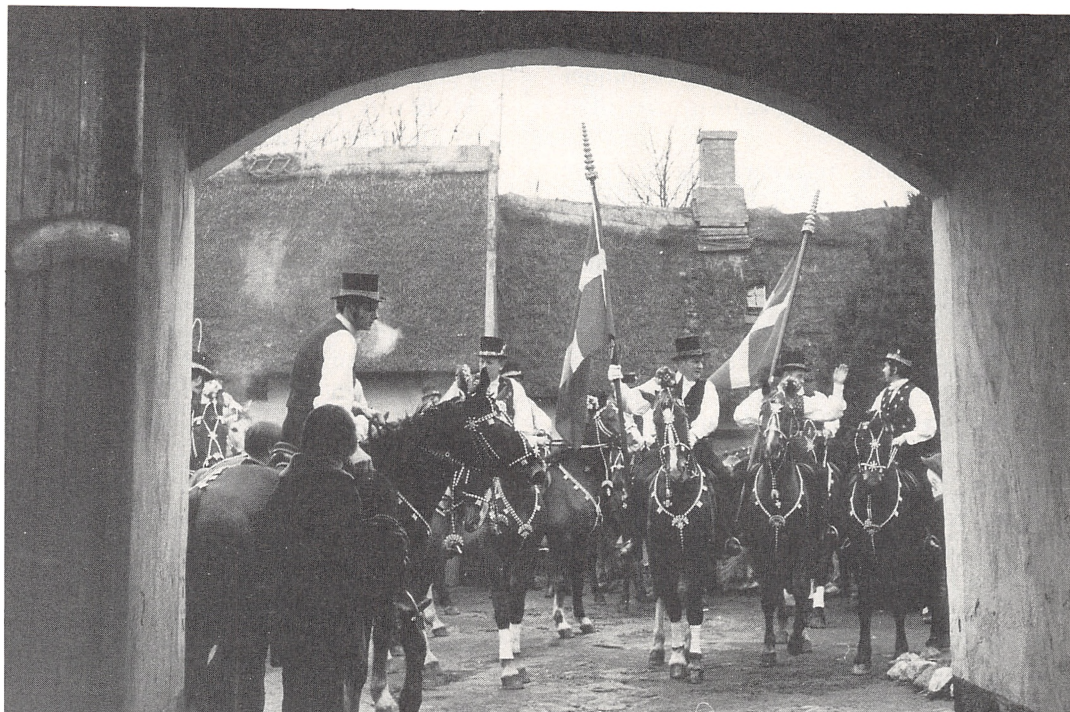
Fastelavnsryttere set gennem vognporten til en af de gamle gårde. De særprægede topstykker på fanerne er rigt udsmykkede træspidser. På flere museer i Holland findes lignende topstykker, som har været benyttet på mastetoppe af hollandske orlogs- og koffardiskibe i 1700-tallet.

Amager Birks segl samt Københavns Amts segl.