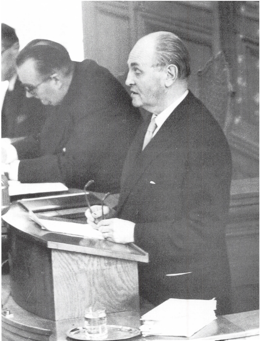
Ole Bjørn Kraft på Folketingets talerstol. I sine indlæg i den offentlige debat indtog den tidligere udenrigsminister og konservative gruppeformand ofte en temmelig uklar holdning til markedspolitikken.