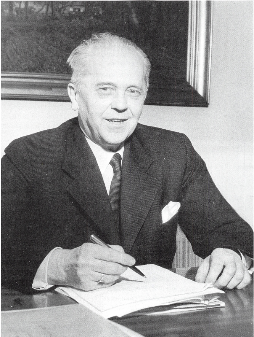
Bertel Dahlgaard gav i den offentlige debat udtryk for en stor interesse for det nordiske fællesmarked. Den radikale leder argumenterede blandt andet herfor ud fra idéen om et kulturelt fællesskab og et »fælles syn« i de nordiske lande på »mange spørgsmål i international politik og økonomi«.