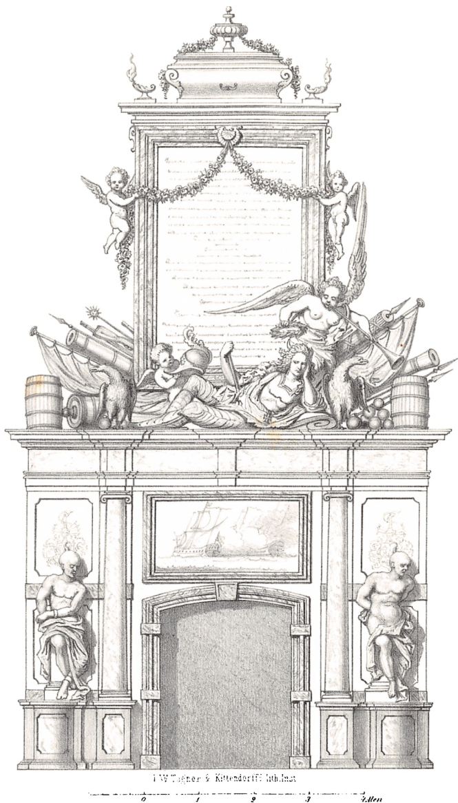
Curt Adelaers Gravmonument i Vor Frue Kirke.