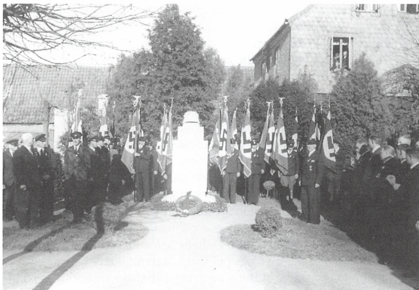
I slutningen af 1930'erne voksede den lokale tyske selvfølelse i takt med Det Tredje Riges ekspansion, og efterhånden som den nazistiske ensretning af mindretallet blev bragt til ende. Her viser medlemmer af det tyske mindretal hagekorsflagene ved en kransenedlæggelse på den nazistiske partidag i Haderslev den 14. april 1938.