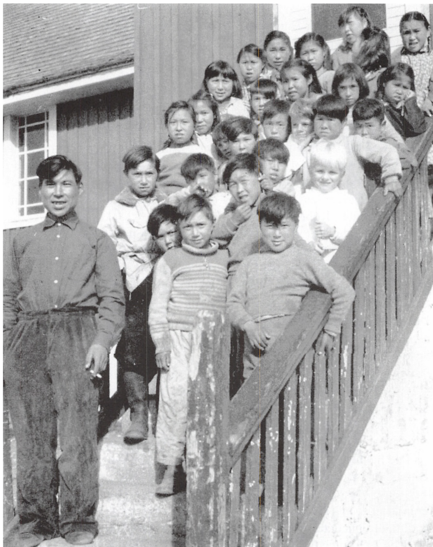
I 1925 indførtes som en foreløbig afslutning på den diskussion om sprogforholdene i Grønland, der havde stået på siden Hans Egedes tid, undervisning i dansk i den grønlandske folkeskole. Her ses skolebørn i Scoresbysund på Grønlands østkyst i 1950'erne. (Efter Ejnar Mikelsen: Svundne Tider i Østgrønland, København 1960, ved s. 40).

moderne verdens viden og kultur – og som nævnt ovenfor var det nu også blevet et krav fra de uddannede kateketers side.