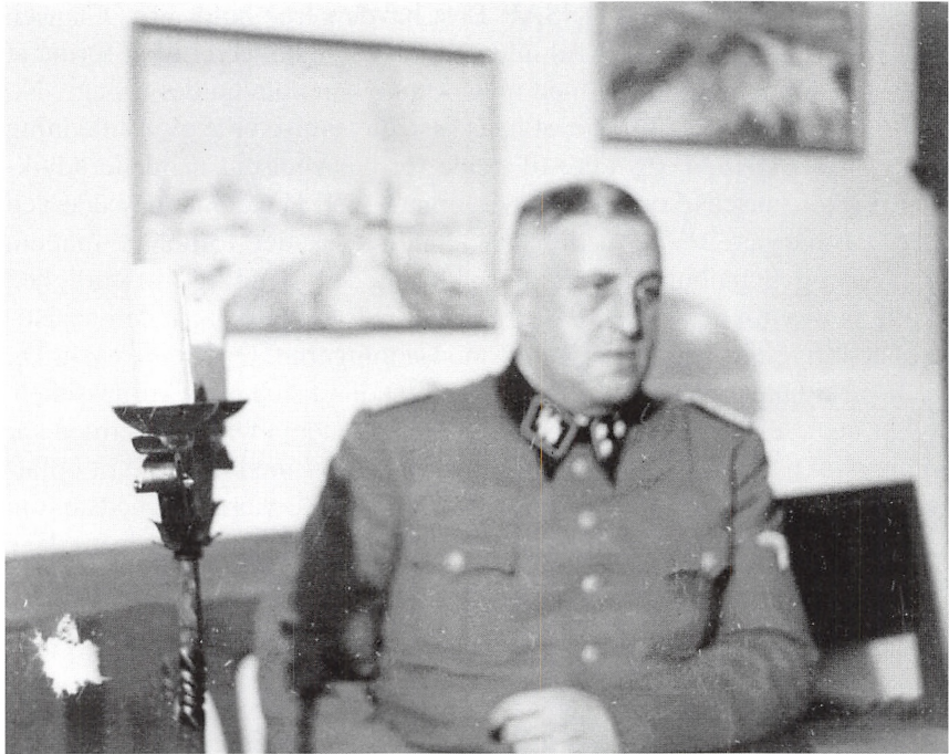
Frits Clausen fotograferet i sit hjem i Bovrup i SS-uniform kort efter besøget i Korsør i foråret 1944.

uger ikke indberettede til det tyske udenrigsministeriet om de fortsatte storme i DNSAP's lille vandglas. 113 Det skyldtes ikke kun, at han havde andre og vigtigere at tage sig af.