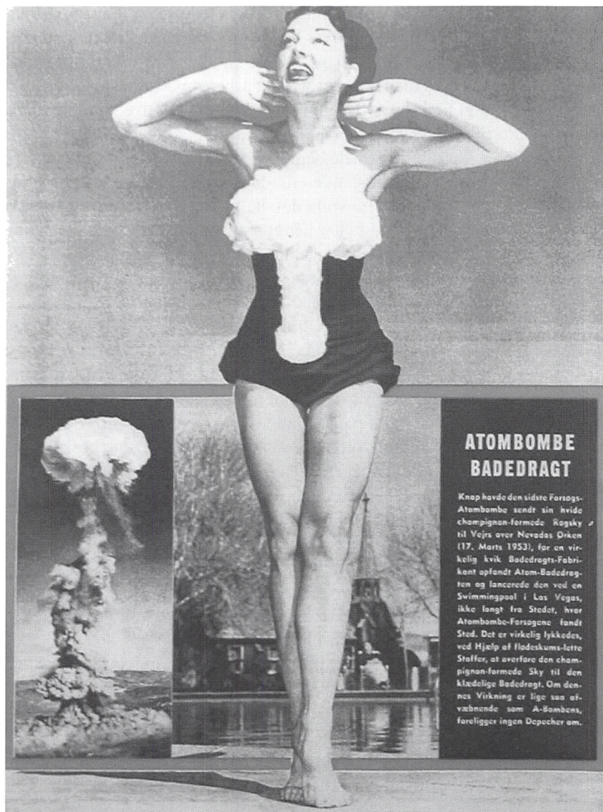
Atombadedragten. (Billedbladet 1953).

berømte, husstandsomdelte pjeces »Hvis Krigen kommer« under stor politisk og mediemæssig bevågenhed. En pjeces, der skulle informere og berolige befolkningen, men som på det sidste område må have haft den modsatte effekt, hvis danskerne da ellers læste og gennemtænkte pjecens råd,